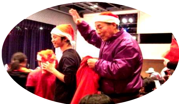
「四季の会」の皆さんも、席の誘導やフェスタの進行をサポート。最後は子どもたちにお菓子のプレゼント