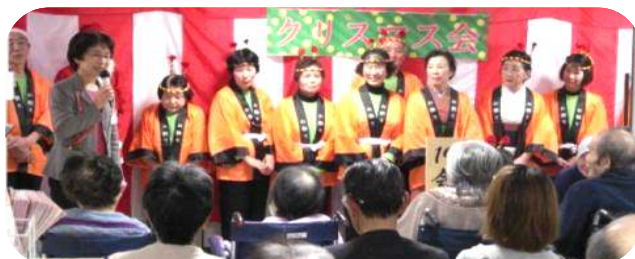
皆さん楽しんでおられました

その後、黒田節などの民謡、日本舞踊、手品、銭太鼓伴奏による安来節などが次々と披露されました。瞬く間に閉会の時間になり、最後に観客の皆さんと「きよしこの夜」を歌い終了しました。司会を務められた赤木さんは、「頑張れとは言いません。私たちの演奏を見て、少しでも元気を出していただけたら。」と繰り返し話されました。クリスマス会に参加された患者さんは、「どれも良かったが、中でも三味線が良かった。また是非聞きたい。」と喜んでおられました。