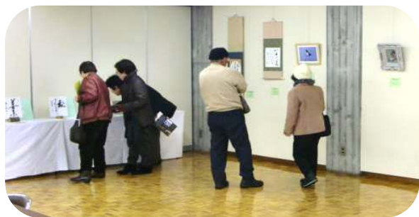
前回のチャリティー小品展の様子

但馬内外で活躍されている、但馬芸術文化会議会員の皆さんによる作品展(展示即売会)です。このチャリティー小品展による収益金は、但馬芸術文化団体への支援及び但馬文化の振興資金、その他の義援金に充てられます。是非お越しいただき、ご鑑賞とご支援をいただきますようお願いいたします。