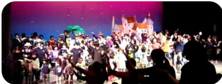
最後は全員で歌とダンスを楽しみました

「四季の会」と、近畿大学豊岡短期大学オペレッタグループの学生の皆さんによるオペレッタの制作は、まず、何を題材にするか?というところからスタートしました。子どもたちが飽きずに楽しく観られ、多くの人物が登場する物語…昨年、一昨年は日本の物語を演じたので、今年度は外国の物語に取り組もう…と、「白雪姫」が選ばれました。そこから脚本づくりが始まり、登場人物の設定・物語の構成など話し合いが重ねられました。