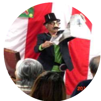
「元気を出して」名司会・笑いを誘った手品披露